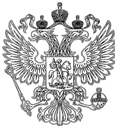
Рисунок № 2