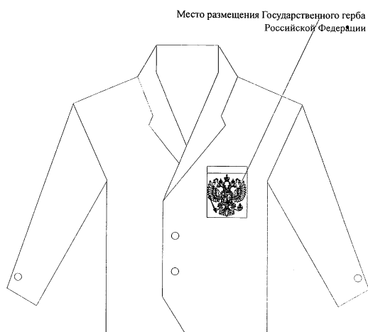
Рисунок № 3