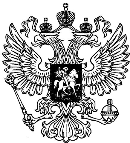
Рисунок № 1

Приложение (утв. приказом Федерального агентства по физической культуре и спорту от 31 января 2005 г. N 11)